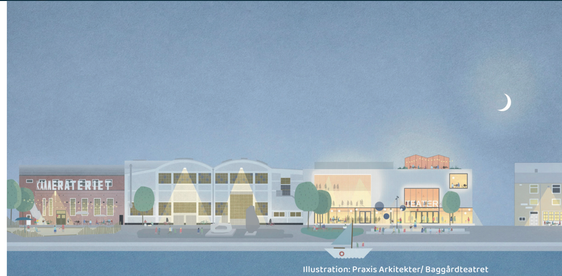
Illustration: Praxis Arkitekter/ Baggårdteatret